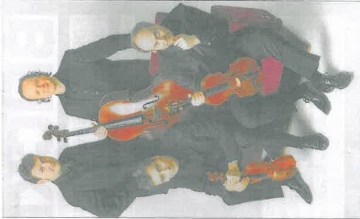
Das einzigartige Repertoire der Gattung Klavierquartett erfährt durch das Mozart Piano Quartet ein neues Gewicht.

Karten für die Konzerte gibt es an der Abendkasse oder im Vorverkauf in der Bürgerzentrale im Emsbürener Rathaus, beim VVV, bei der Buchhandlung Fröhlich, 1 x Schulbedarf in Linpen, Nordhorn und Rhe-