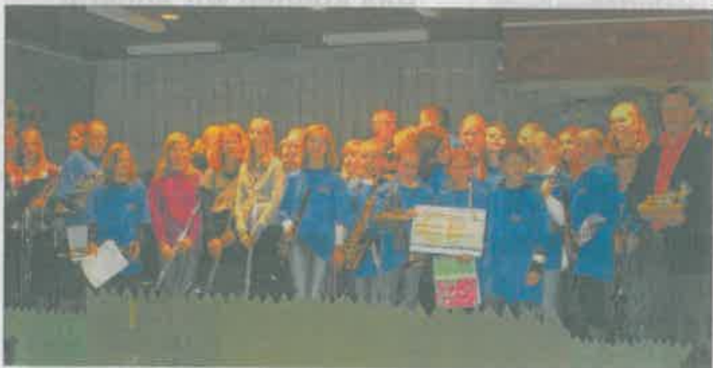
Beeindruckendes Jugendkonzert im Rahmen der Emsbürener Musiktage.