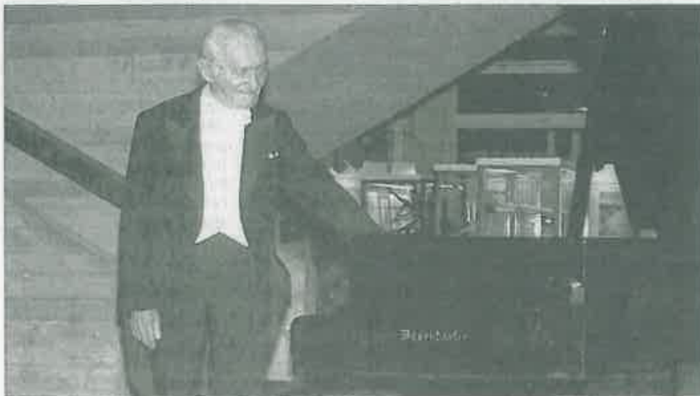
Zehn Jahre konzertierte der Pianist Stefan Askenase anlässlich der Emsbürener Musiktage in der Liudger-Realschule.

Ein kulturelles und musikalisches Erlebnis, sowohl für die Teilnehmer als auch für die Besucher. Und darauf kann die Gemeinde Emsbüren stolz sein.