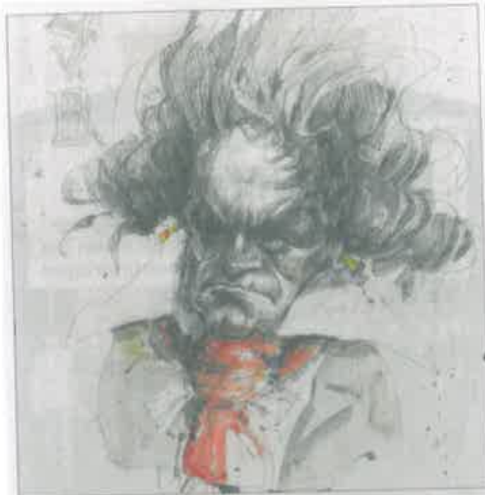
„35 für 35“ – Musikköpfe von Frank Hoppmann.