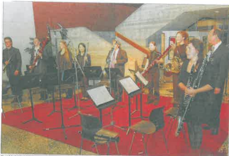
Der Meisterkurs beeindruckte mit seinem Konzert im Rahmen der Emsbürener Musiktage.