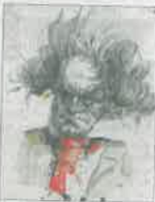
Beethoven als Karikatur.

Weitere Infos zu den Musiktagen gibt es unter Tel.: 0 59 03 93 00-155 sowie unter www.emsbuerner-musiktage.de .