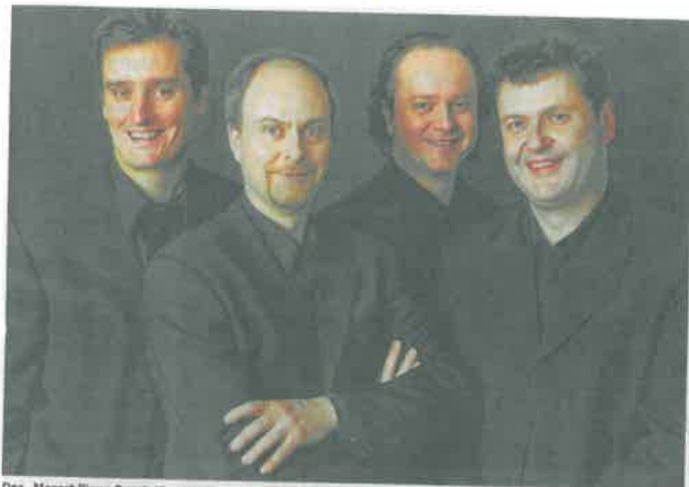
Das „Mozart Piano Quartet“ gastiert am 18. Oktober in Emsbüren.