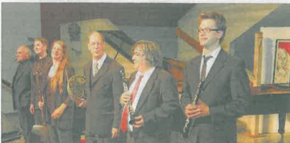
Außergewöhnliches boten die Dozenten anlässlich ihres traditionellen Konzertes.

Das dargebotene Sextett überrascht vor allem durch seinen hohen Unterhaltungswert im positiven Sinne. Im Stil recht romantisch, voller Esprit und musikalischem Witz, so auch mit großer Spielfreude von den Musikern interpretiert, war es genau der richtige Höhepunkt und gleichzeitig Startschuss für die 35. Emsbürener Musiktage und 10. Meisterkurse.