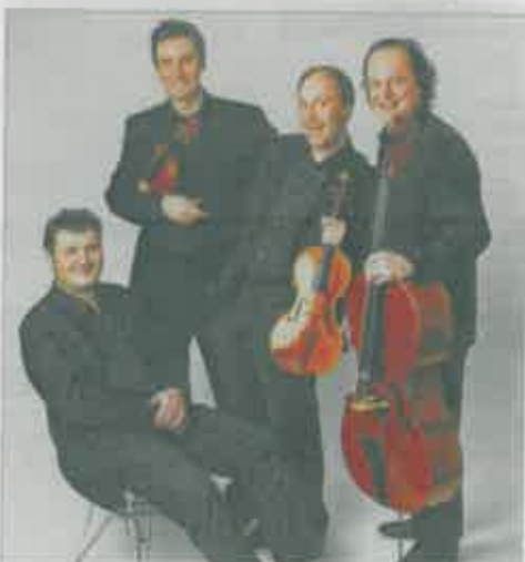
Ein wunderbares Konzert mit dem „Mozart Piano Quartet“ zum Beginn der 35. Embsbürener Musiktage.

Als Zugabe gab es den langsamen Satz aus Schumanns Quartett „Es-Dur“, schlicht und nobel als Abschluss eines besonderen Konzertes vorgetragen.